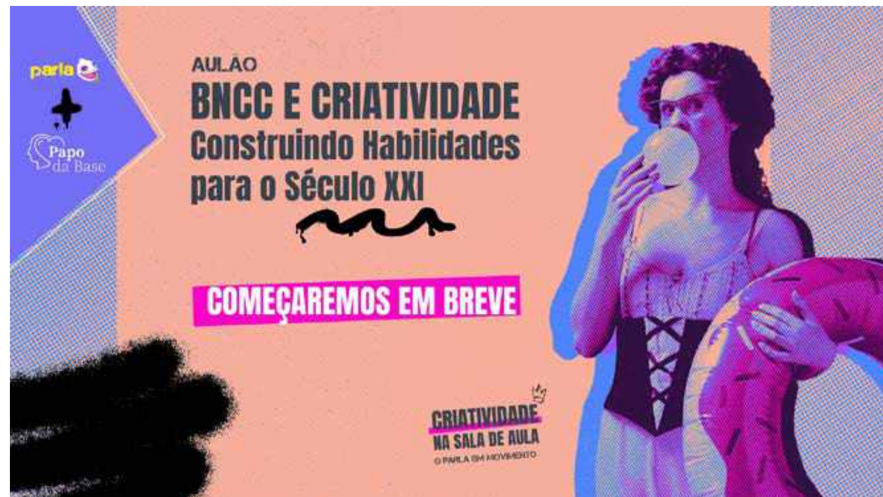
Peças da campanha Tá no mundo, tá na escola, tá na Base, que marcaram presença nas redes sociais do Movimento pela Base em 2024