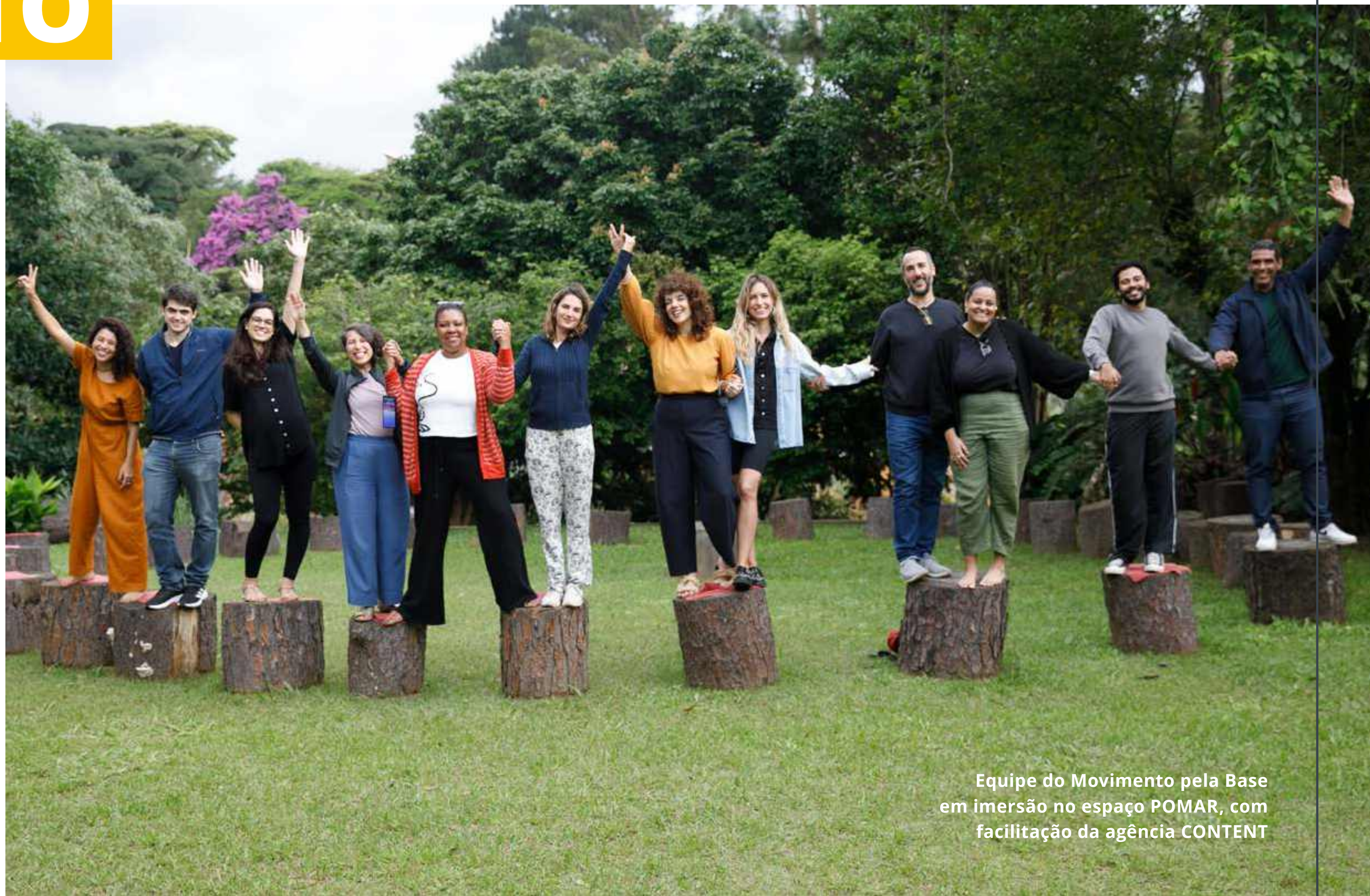
Equipe do Movimento pela Base em imersão no espaço POMAR, com facilitação da agência CONTENT

Em 12 anos de atuação, desenvolvemos pesquisas e produzimos conhecimento, monitoramos o avanço da causa, incidimos em políticas públicas e articulamos uma rede de especialistas e instituições para garantir que todas as crianças e jovens brasileiros possam exercer os seus direitos de aprendizagem e desenvolvimento.