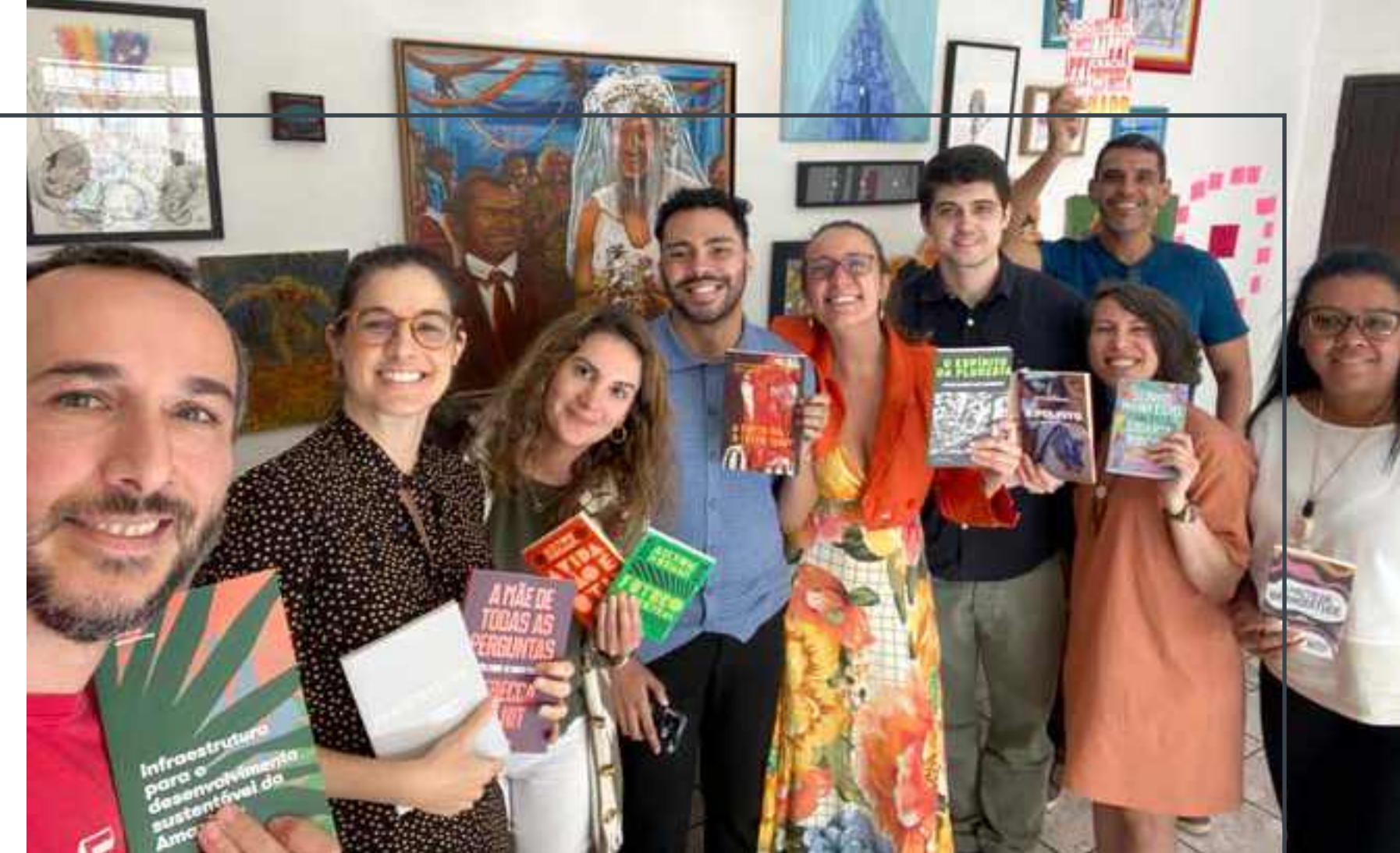
Reunião de Planejamento estratégico 2025-2030

A chegada de uma nova liderança impulsionou a revisão do planejamento estratégico, envolvendo equipe e parceiros na construção de um plano robusto para a consolidação da BNCC . Essa articulação reafirma nosso compromisso com uma educação de qualidade promotora de justiça social, garantindo